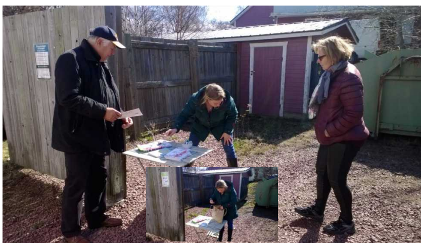
Inspektion på deponin och Mise besök