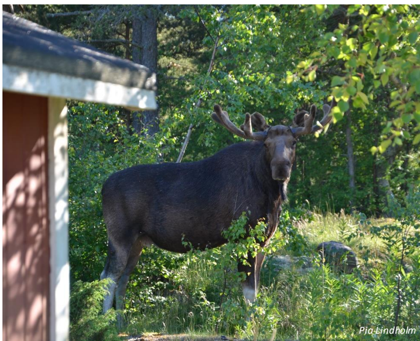
Älg på besök