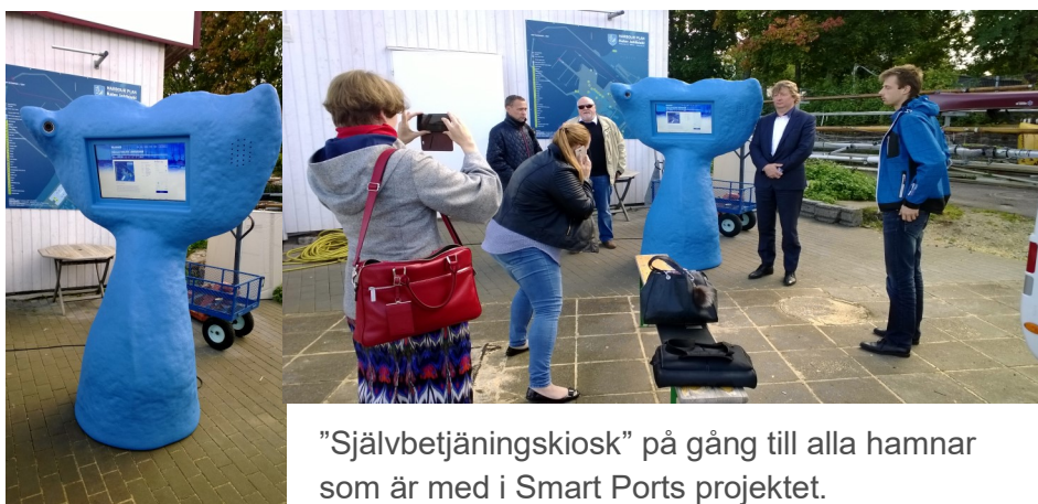
"Självetjäningskiosk" på gång till alla hamnar som är med i Smart Ports projektet.

Stopptid för material är 1.11.2016 kl. 18.